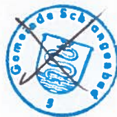
Marco Eyring Bürgermeister

Der Gemeindevorstand der Gemeinde Schlangenbad