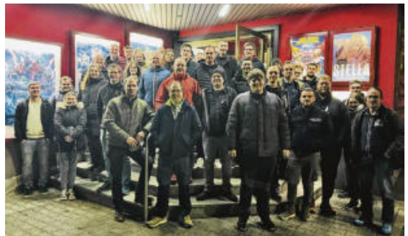
Knapp 40 Einsatzkräfte unserer Freiwilligen Feuerwehren folgten der Einladung ins Bad Schwalbacher Kino.

Die Gemeinde Schlangenbad ist sich bewusst, dass der Einsatz der Freiwilligen Feuerwehren oft unbeachtet bleibt, obwohl er von unschätzbarem Wert für unsere Gemeinschaft ist.