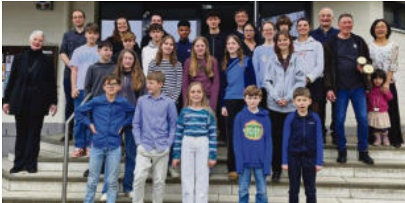
Mitwirkende des Jahresvorspiels 2024

Musikschulverein (VFmU e.V.) kehrt zu traditionellem Format zurück